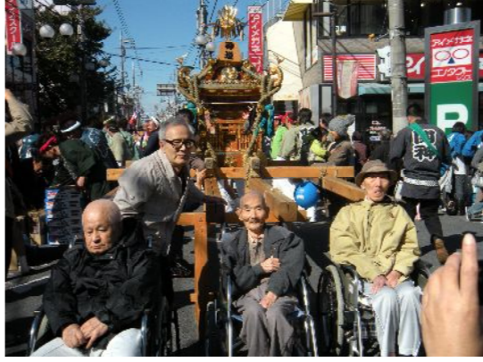
お神輿の前で記念撮影です♪