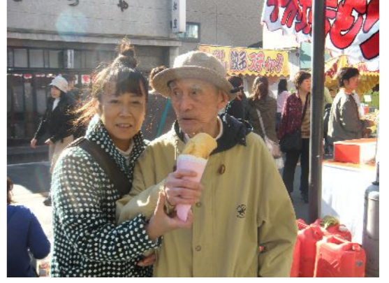
意外と甘党!?クレープ大好評でした

11月3日、桶川市内の中山道で行われた「桶川市民まつり」へ行ってきました。想像していた通り、道は人・人・人だらけ！でしたが、何とか車椅子を走らせ、お神輿を見たり、屋台で買い物をしたりと楽しむことができました。夏祭りは、夏の暑さに加え、夜に開催されるので参加がなかなか難しいのですが、陽気の良い秋に、しかも屋間に行われる市民祭りは、利用者の皆さまにはぴったりのお祭りでした。