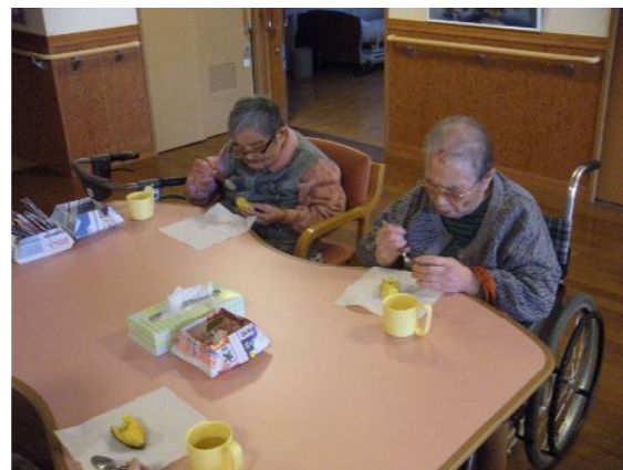
スプーンで慎重に……♪