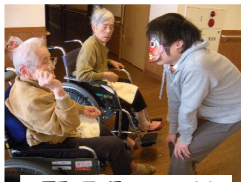
両手に豆を握って、せーの!!