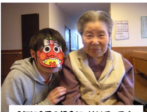
1年に1回の記念に、はいチーズ!