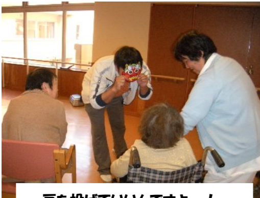
豆を投げていいんですよ~!