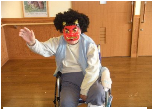
恒例の佐藤赤鬼! 今年も迫力満点!