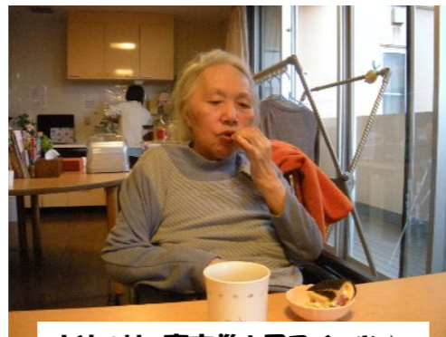
おやつは、恵方巻き風スイーツ♪