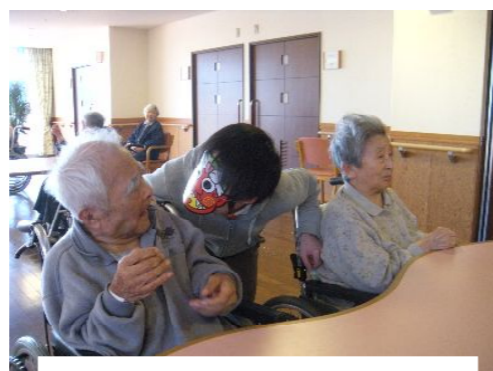
「うわ~」とビックリの登場です!