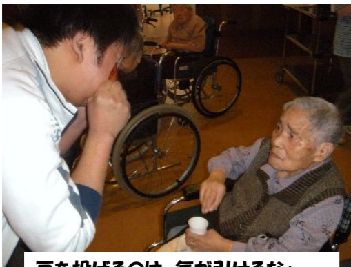
豆を投げるのは、気が引けるなあ~