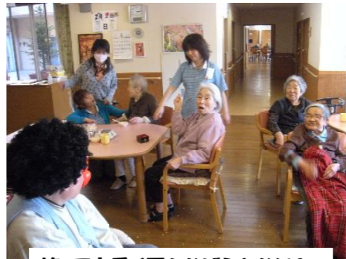
笑って上手く豆をなげられないよ