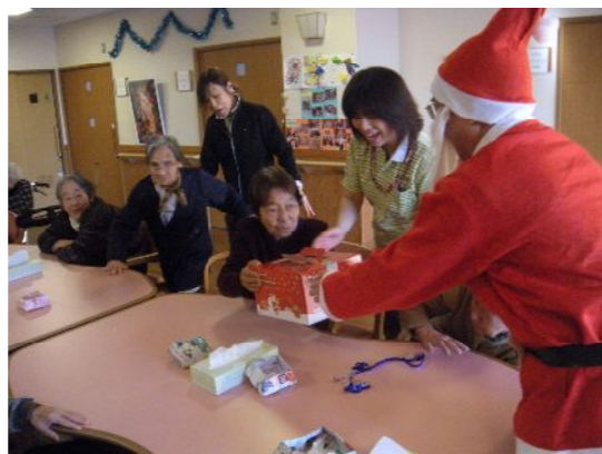
サンタが来た！と、皆様大集合！