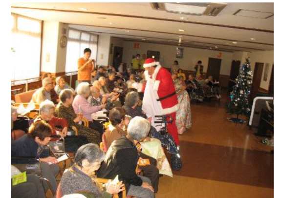
大きいサンタ登場！プレゼントを貰いました

12月20日、ソプラノ・ヴァイオリン・ピアノの演奏家の皆様が、素敵なクリスマスコンサートを披露してくださいました！