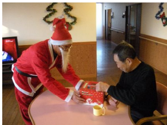
箱の間隙から見えるケーキに視線集中！