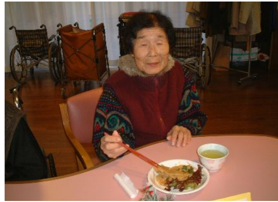
ニラが沢山入っていて美味しいわよ〜