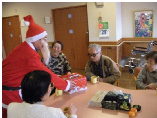
大きいケーキの箱に皆様ビックリ！