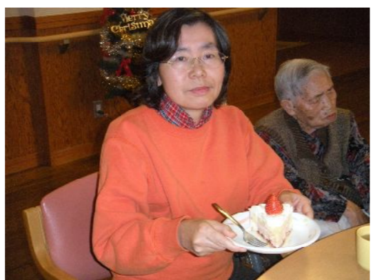
やっぱり一番人気は、定番！苺の生クリームケーキです。おいしそうです～