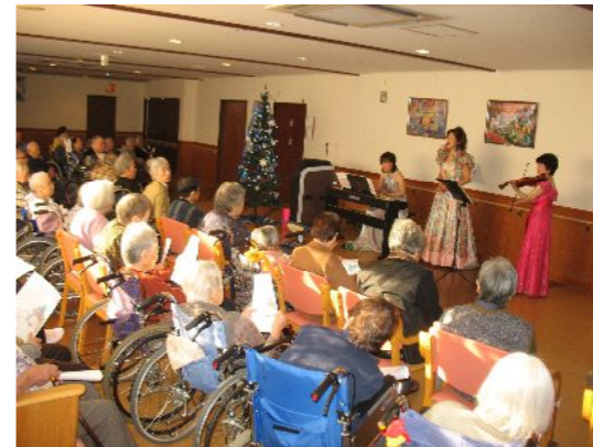
皆様、聴き惚れていらっしゃいます♪