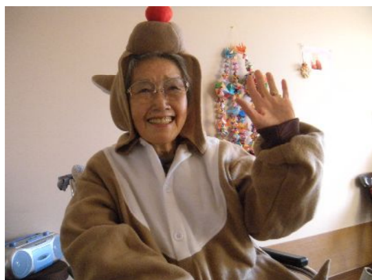
「私も着させて！」と、なんとトナカイに大変身です。お似合いですよ～