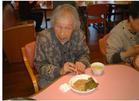
珍しい食べ物ですね〜♪

一年の集大成として相応しく、珍しくて美味しい「韓国風お好み焼き」作りをしました! お好み焼きは作ったことがあるので、「覚えてるわよ」「切り方はお好み焼きと同じね」と手馴れた手順で下準備が進みました。今回のポイントは、盛りだくさんのニラです! 特別な作り方ではありませんが、具材を変えたことで、味は劇的に変化しました。「簡単そうだから、家でも作ってみるわ」と、嬉しいお言葉も。