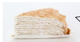
ホットケーキの生地に見えない完成度の高さ!