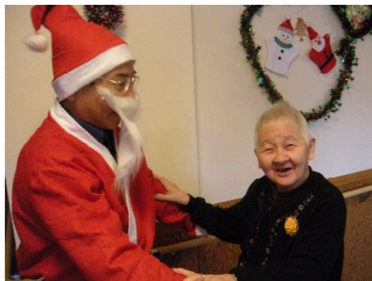
「あらら、施設長さん！」と正体判明♪

誰もが心躍る、クリスマスの日がやってきました！ついつい、童心に戻ってウキウキしすぎてしまうのは、職員だけでしょうか？いえいえ、入居者の皆様と・・・あらあら施設長まで！いつもは、スーツ姿の施設長が、サンタに変身して各ユニットへプレゼントのケーキを持って行きました！さて、皆様の素敵な笑顔をご覧ください～♪