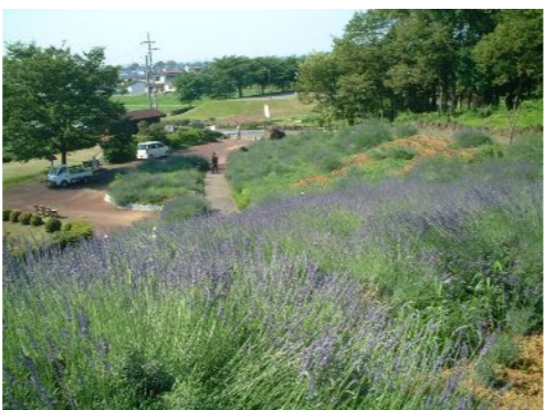
眺めの良いラベンダー山より