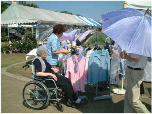
「あら、この服いいじゃない!」