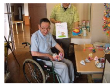
折り紙の腕前が口癖のお父さん♪