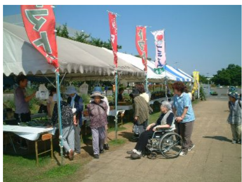
「野菜も売っているわよ~!」