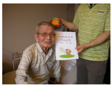
関西の川で陽気なお父さん♪