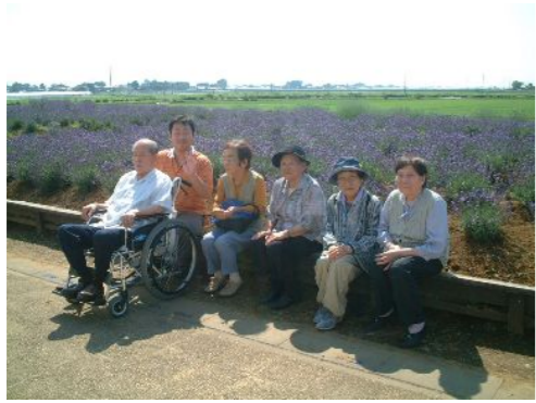
ラベンダーの香りで癒されて・・・