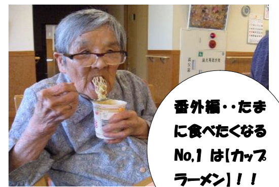
番外編・・・たまに食べたくなるNo.1は【カッパラーメン】!!