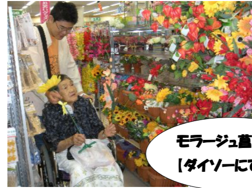
モラージュ葛藤 【ダイソーにて】