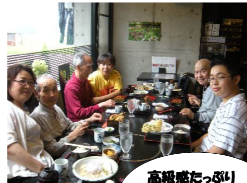
高級感たっぷり 【藤はら】