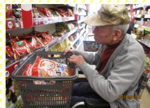
ぽたぽた焼きの大ファン↑