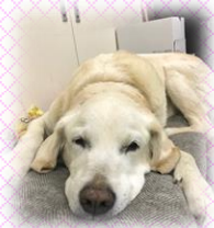
令和もよろしくだワン♥