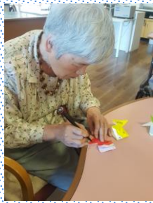
折り紙で 金魚のモビール作り