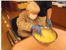
クルクルと混ぜます