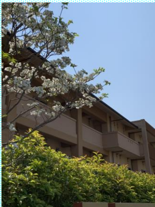
ハナミズキ 施設の正面で皆様をお迎えします