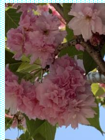
八重桜 たくさんの花びらが 見事です