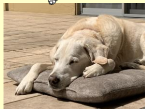
大好きな中庭でお昼寝中