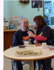
デュエット!? 笑顔が素敵です