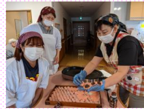
フロ並みの腕前 桜餅が見事!!