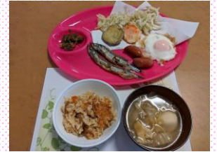
本日の会食メニューは 天ぷら・目玉焼き ししゃも・ふきの煮物 焼き込みご飯・豚汁・他