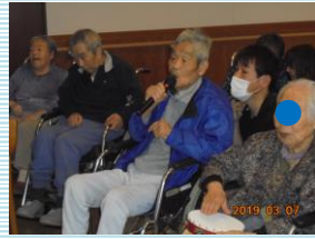
季節に合わせて「北国の春」を唄います！