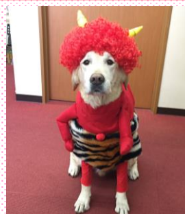
鬼退治ならボクにまかせて!!