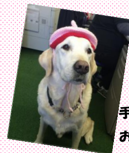
手編みの帽子がお似合いです