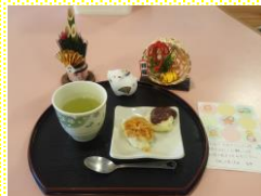
大根おろし、餡子をのせて出来上がり！