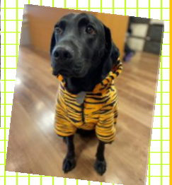
チェイスもなかなかのオシャレさん♥ まるでモデルみたい…