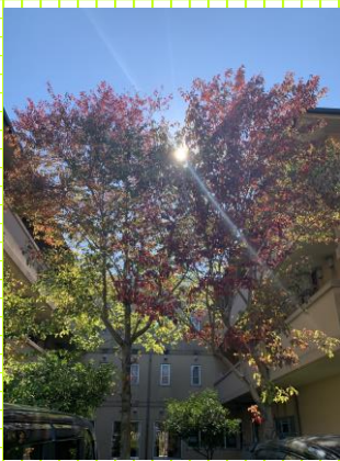
木々は美しく色づき、 中庭には秋のバラが咲いています

日ごとに寒さが身に染みる季節となりました。今月はインフルエンザの予防接種を予定しています。寒い季節は免疫力も低下しがちで、感染症には十分な注意が必要です。健康に留意して寒い冬に備えていきたいと思います!!