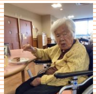
「美味しくできたね～」