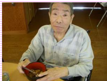
「すいとん」懐かしい味!! 昔を思い出しますね...