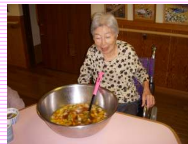
ちょっとソーダが効いて オシャレなフルーツポンチ♡