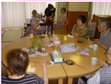
皆様と、楽しくワイワイ★