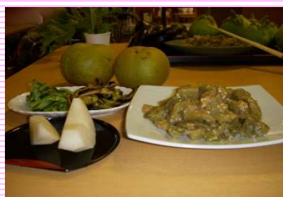
美味しそうなシギ焼き♡