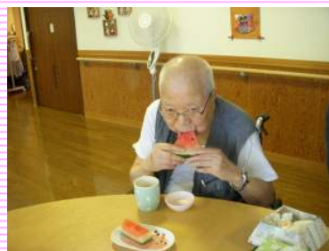
立派なスイカ とっても甘かったです♡