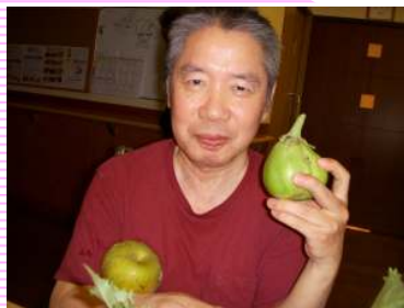
白茄子ってご存知?